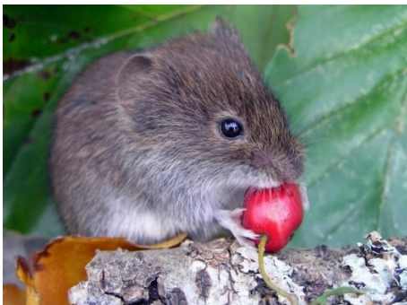
Norník rudý, běžný lesní hlodavec, kterého byste mohli potkat i v našich lesích, je vhodný modelový druh pro studium dopadů klimatických změn na živé organismy